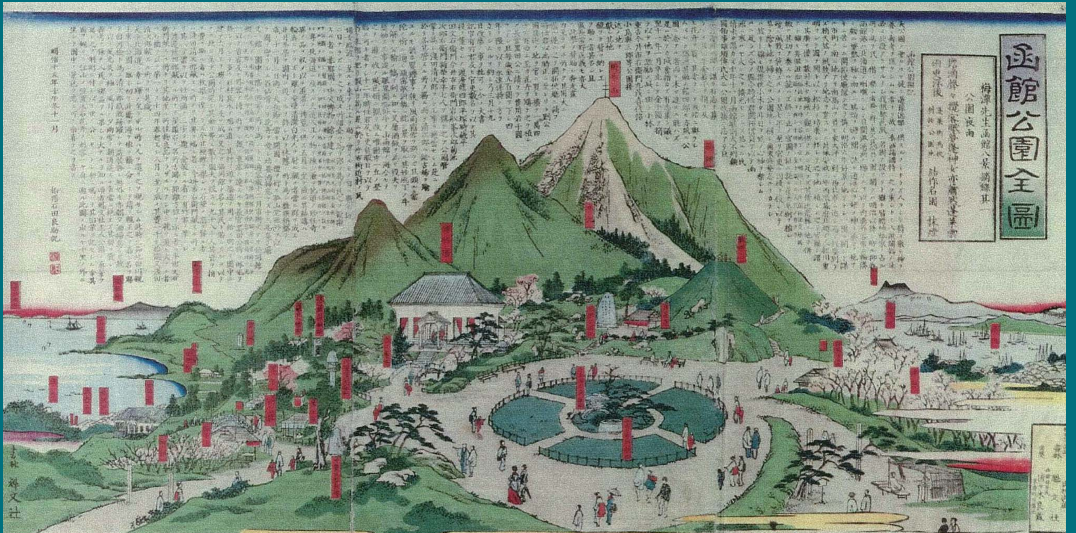
1882 (明治15)年に作られた絵図