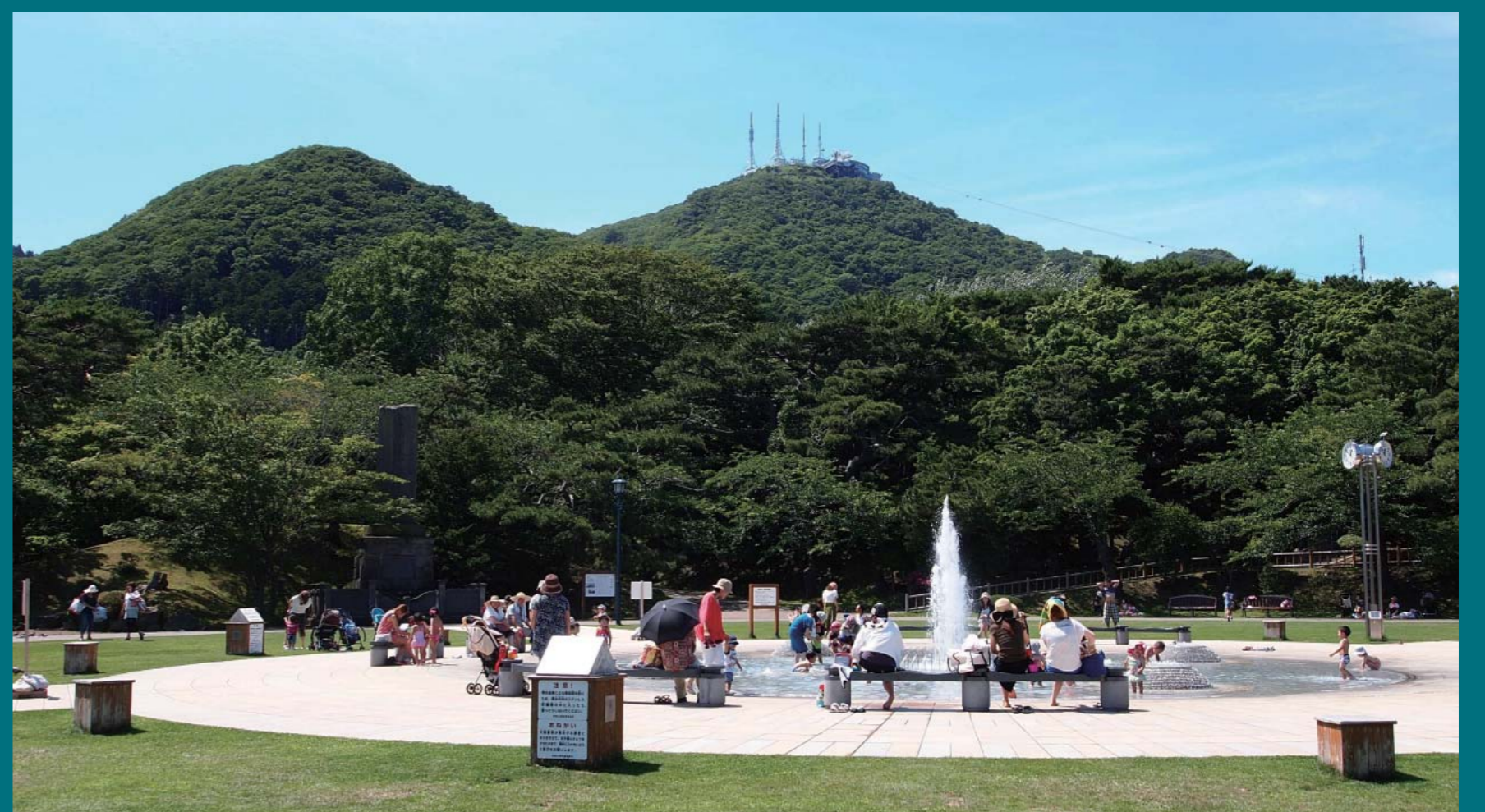
函館公園より函館山を望む