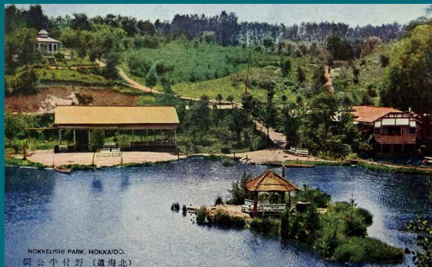
昭和初期の絵はがきに見る当時の野付牛公園の様子

開拓当時の樹木や、当初造成された池を中心とする公園の骨格が今なお残され、北見市の発足で消えた野付牛の名称を冠する数少ない場所でもある。北見市街の中心部近くにある大きな緑のオープンスペースとして、貴重な存在となっている。