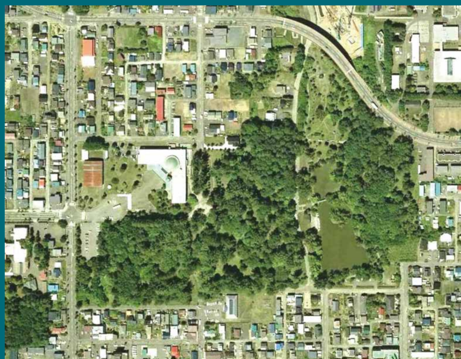
現在の野付牛公園周辺(国土地理院提供空中写真(2015年撮影)より)